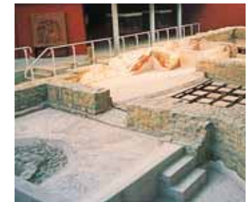
OSTERBURKEN LE MUSÉE ROMAIN