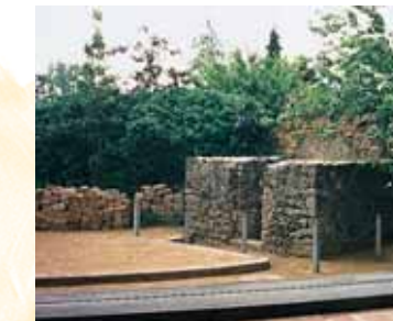
GROSSKROTZENBURG TOUR D'ANGLE DU FORT