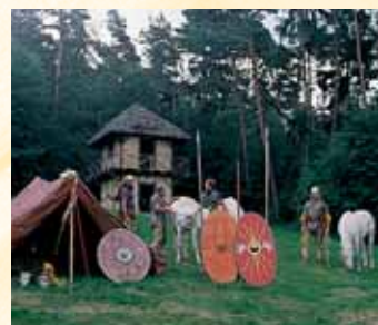
BUTZBACH JOURNÉE ROMAINE