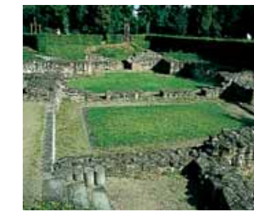
HANAU ÉTABLISSEMENT DE BAINS