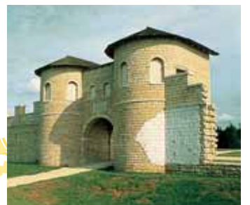
WEISSENBURG I. BAY. LE FORT ROMAIN «BIRICIANA»