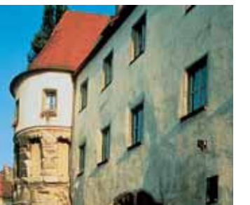
REGENSBURG LA PORTE PRAETORIA