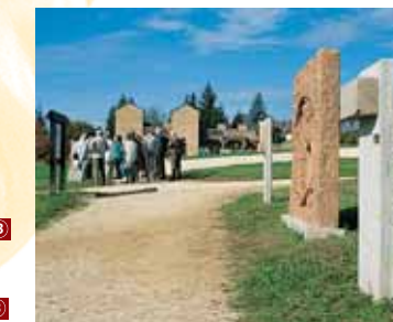
WELZHEIM LE FORT