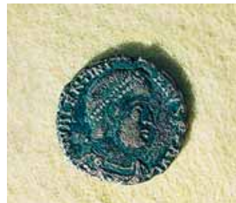
BAD HÖNNINGEN PIÈCE DE MONNAIE TROUVÉE