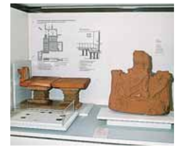
MILTENBERG LE MUSÉE DE LA VILLE