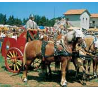
PFÜNZ FÊTE DU CHÂTEAU FORT