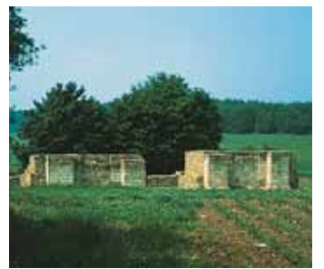
RAINAU-DALKINGEN PORTE DU LIMES