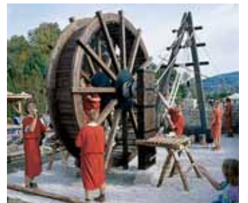
AALEN LE MUSÉE DU LIMES