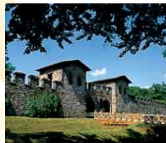
BAD HOMBURG SAALBURG