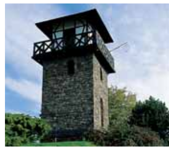
RHEINBROHL TOUR DE GUET DU LIMES NO. 1

Nous espérons que les touristes pourront se faire une idée ou enrichir leur savoir sur le passé des romains dans cette région et leur souhaitons également un séjour agréable et reposant dans le paysage varié de cette région frontalière romaine.